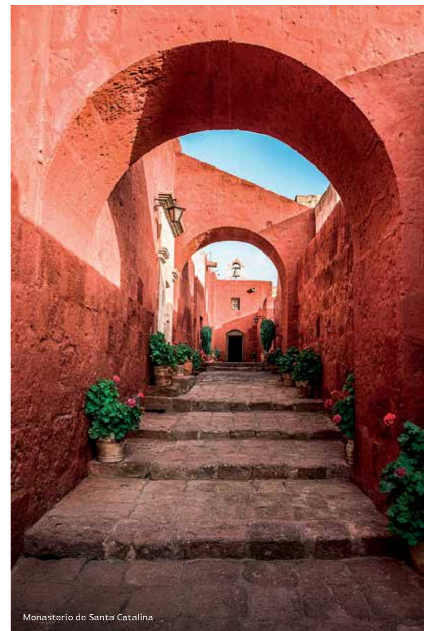
Monasterio de Santa Catalina