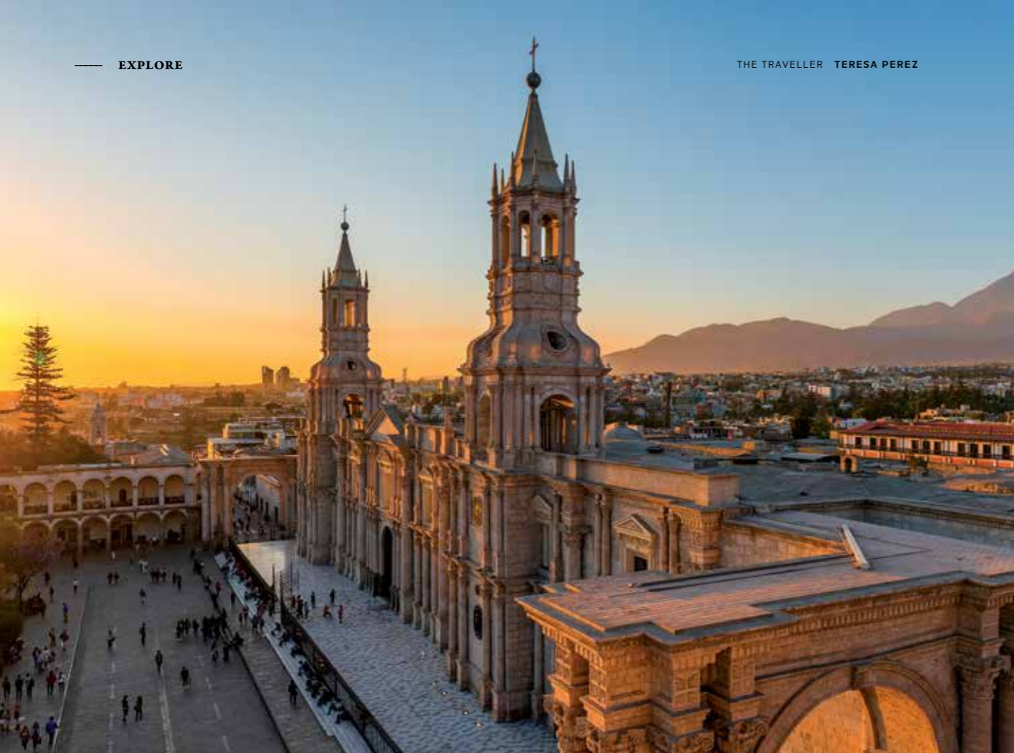
Plaza de Armas: vida social, jardins do século 18 e construções coloniais do porte da imponente Catedral de Arequipa

barroco andino: uma mistura de plantas, animais e desenhos bordam as paredes de pedra branca, que adquirem um tom dourado ao pôr do sol. A praça é cercada por galerias e lojinhas que vendem o melhor do artesanato arequipenho, como joias de prata, pashminas e peças feitas com a finíssima lã de vicunha e tecidos andinos. E bem ao lado, fica mais um